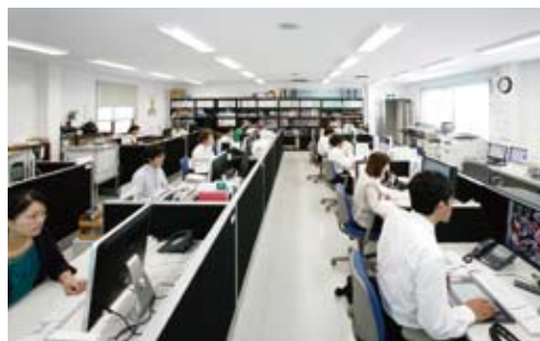
▲ DTPからWEBまで、充実した設備で表現します